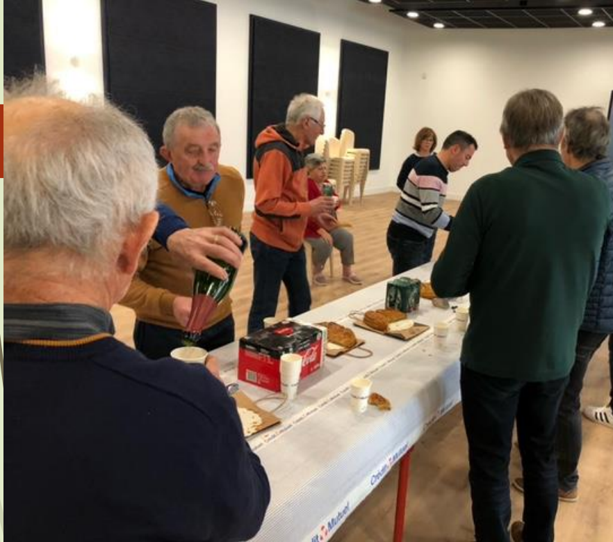
Galette des rois